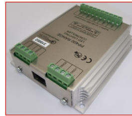
Controller GS 420