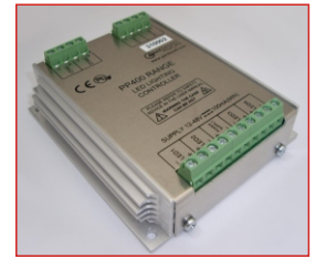
Anschlüsse GS 420